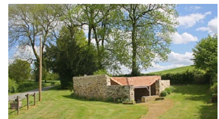
Lavoir de la Remaude