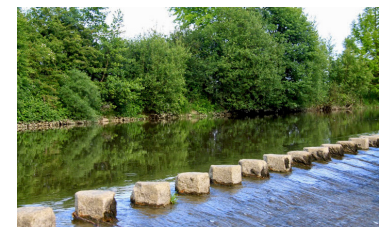
Chaussée des "Petits Bonhommes"

Comité • FFRandonnée Vendée : 02 51 44 27 38, ffrando85@orange.fr , http://vendee.ffrandonnee.fr .