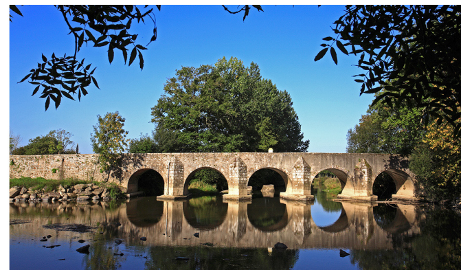
Pont gallo-romain sur la Sèvre Nantaise